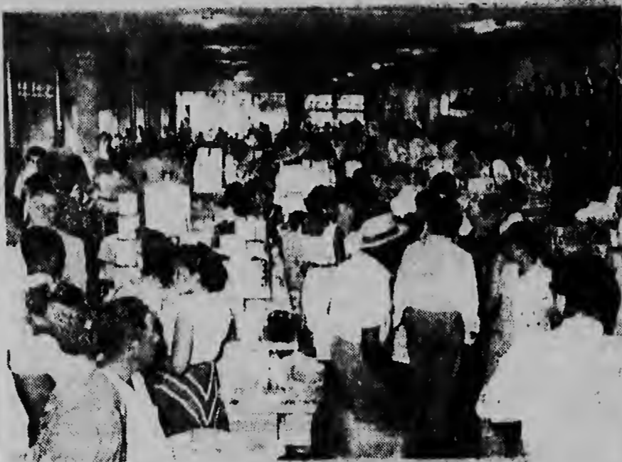
Het interieur van Warehouse van der Ree.